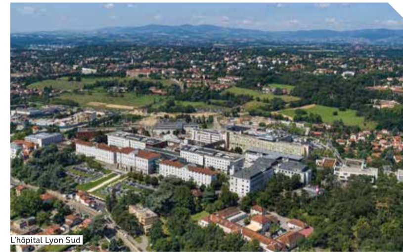
L'hôpital Lyon Sud

Les Hospices Civils de Lyon (HCL) décident au début des années 2000 de regrouper progressivement les activités hospitalières de Sainte-Eugénie sur le site Jules Courmont. Ce déménagement connaît une nouvelle étape fin 2021 avec la fermeture du château de Longchêne. Ce mouvement s'inscrit dans un grand plan de modernisation de l'hôpital Lyon Sud, amplifié par l'arrivée du métro en 2023 !