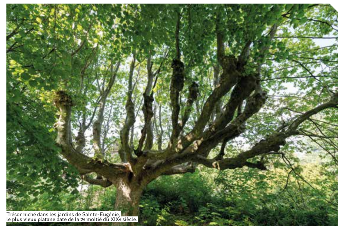
Trésor niché dans les jardins de Sainte-Eugénie, le plus vieux platane date de la 2 e moitié du XIX e siècle.

Tout le projet a été pensé pour composer avec l'existant et porter une très grande ambition environnementale. Comment ? D'abord en évitant au maximum les transports de matériaux sur site et les déchets liés au projet. 80% des voiries existantes seront conservées. Plus d'une quinzaine de bâtiments historiques seront réhabilités. Ensuite, en intervenant au minimum sur les espaces naturels et en imperméabilisant le moins possible les sols avec, par exemple, l'utilisation de matériaux poreux dans les revêtements de sols. Enfin, en construisant des bâtiments bas carbone et peu consommateurs d'énergie. Le parc se prolongera au plus près des habitations, la végétation créant une unité entre les espaces publics et privés. Cultiver les richesses du site pour y inventer de nouveaux modes de vie, tel est l'esprit du projet du Vallon de Saint-Genis-Laval.