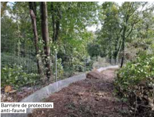
Barrière de protection anti-faune