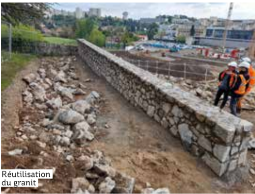
Réutilisation du granit