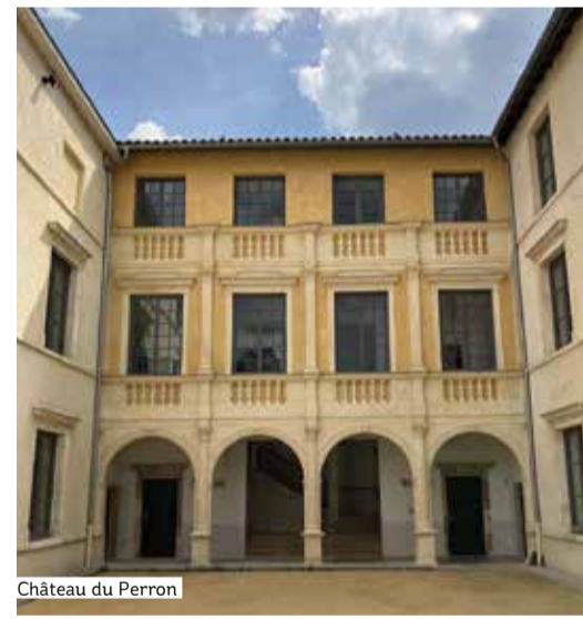
Château du Perron

Le Vallon de Saint-Genis-Laval trouve alors sa configuration actuelle avec ses deux pôles hospitaliers : Jules Courmont (site du Grand Perron) et Sainte-Eugénie (site de Longchêne). Reliés par une voie goudronnée en 1974, les deux hôpitaux fusionnent en 1979 pour former le Centre Hospitalier Lyon Sud. En 2021, les fonctions hospitalières de Sainte-Eugénie se rassemblent sur le site de Jules Courmont.