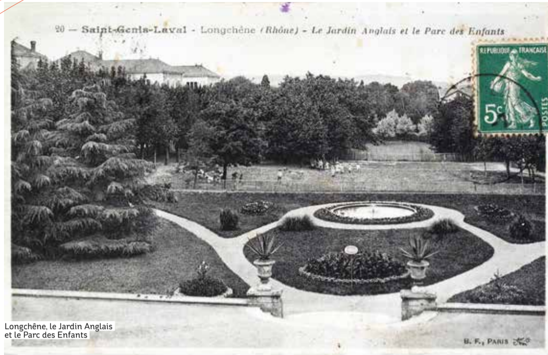
Longchêne, le Jardin Anglais et le Parc des Enfants