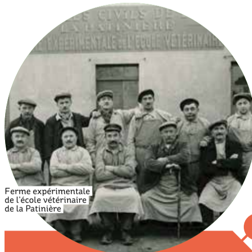
Ferme expérimentale de l'école vétérinaire de la Patinière

Le site puise ses racines dans le lien à la terre, la présence de l'eau, les vues dégagées, la douceur de ses reliefs. De tout temps, le Vallon a été un lieu accueillant et fertile.