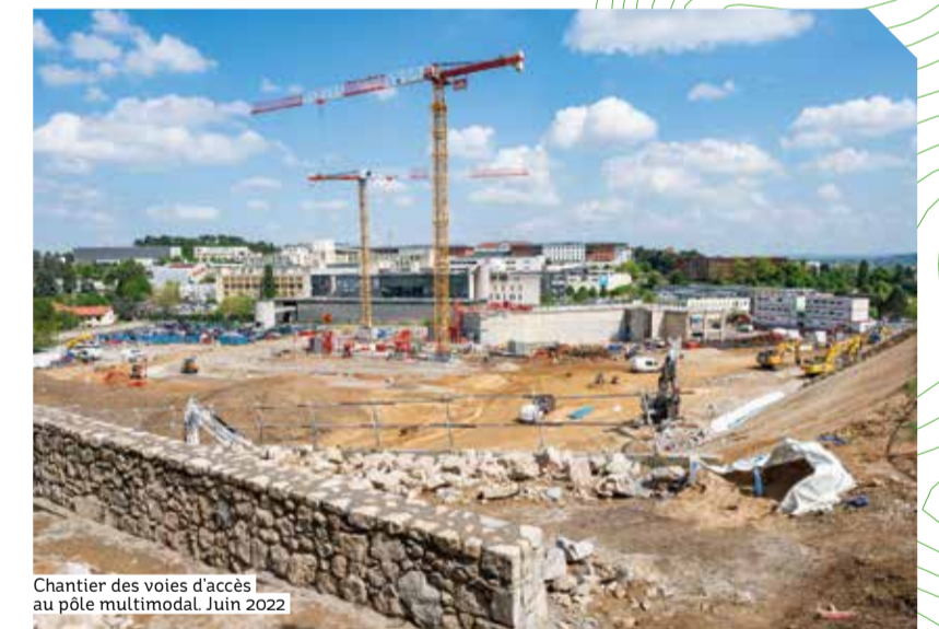
Chantier des voies d'accès au pôle multimodal. Juin 2022

Le projet porté par les HCL est d'une grande complexité d'exécution, car il implique le maintien du plein potentiel de l'activité hospitalière, tout en déployant la reconfiguration et la transformation des lieux. À terme, c'est tout l'environnement du site qui s'améliore, au bénéfice des patients, des accompagnants et des personnels soignants et administratifs. L'hôpital se connecte à tous les territoires de la métropole par une offre de transports renouvelée. Il s'ancre dans son environnement et s'ouvre sur la ville de Saint-Genis-Laval, tout en renforçant son attractivité au sein de la métropole et de la région.